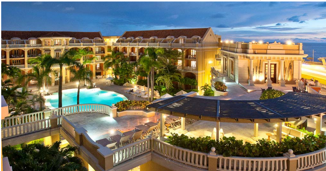
Hotel Sofitel Santa Clara

Sua extensa muralha, antiga proteção dos seus habitantes, rodeia todo o centro histórico da cidade com construções conservadas desde o século XVI. Excelente arquitetura que deslumbra com seus muros, baluartes, fortes, casa coloridas, varandas coloniais, restaurantes e hotéis boutique..