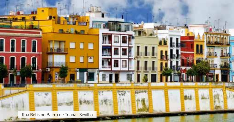
Rua Betis no Bairro de Triana · Sevilha