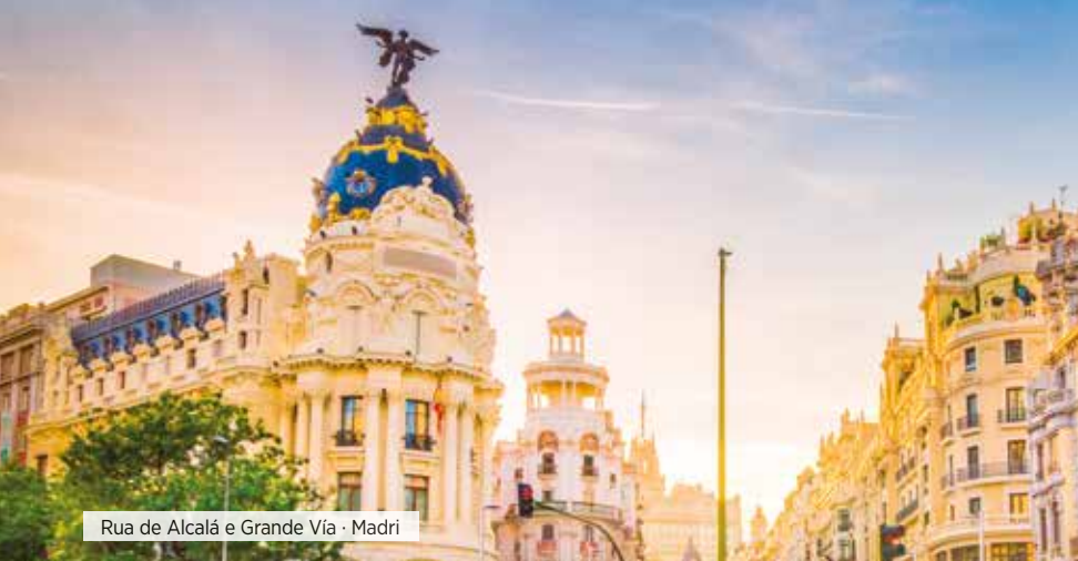
Rua de Alcalá e Grande Vía · Madri