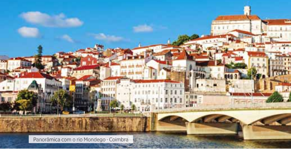
Panorâmica com o rio Mondego · Coimbra