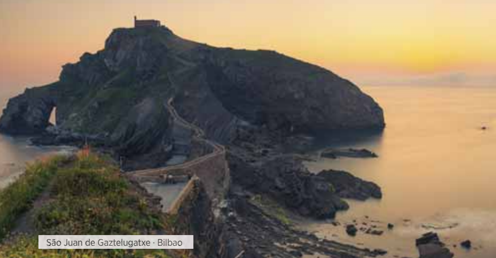
São Juan de Gaztelugatxe - Bilbao